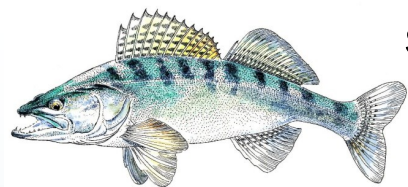
Sandre 50 cms